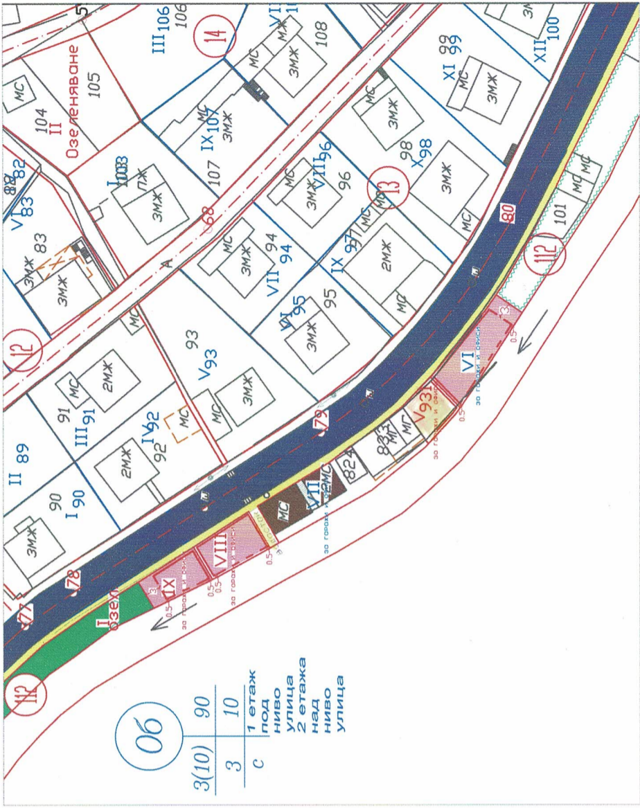
ПЛАН ЗА ЗАСТРОЯВАНЕ: